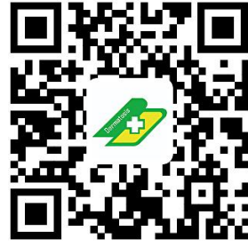
医院权力事项清单